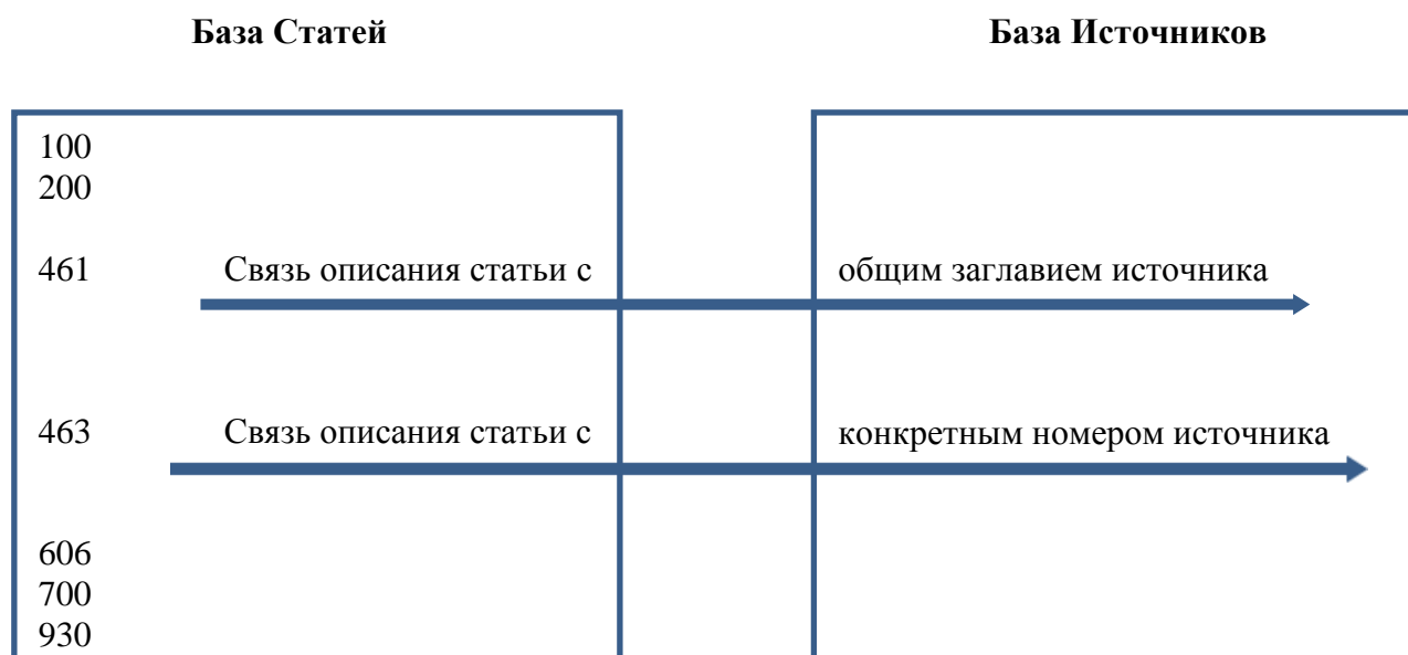
Схема 1. Связь описания статьи с периодическим изданием